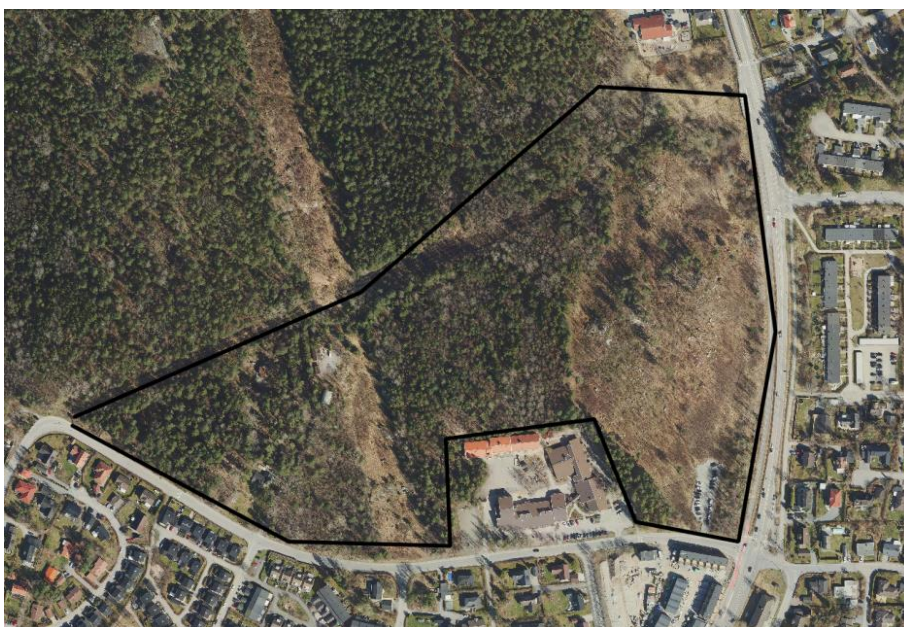
Figur 4: Området Gripsvall markerat med svart linje.

Kommunstyrelsens utskott för stadsbyggnad, fastigheter och klimat meddelade den 22 maj 2023, § 40, positivt planbesked och gav stadsbyggnadsnämnden i uppdrag att pröva ny detaljplan för fastigheterna Skarpäng 62:1-62:7 och 62:10-62:11 i syfte att möjliggöra för utveckling av småhusbebyggelse, se figur 4. När detaljplanen har fått laga kraft kommer området att tas in i VA- verksamhetsområdet. Förberedande arbete inför planläggning påbörjades under hösten 2023.