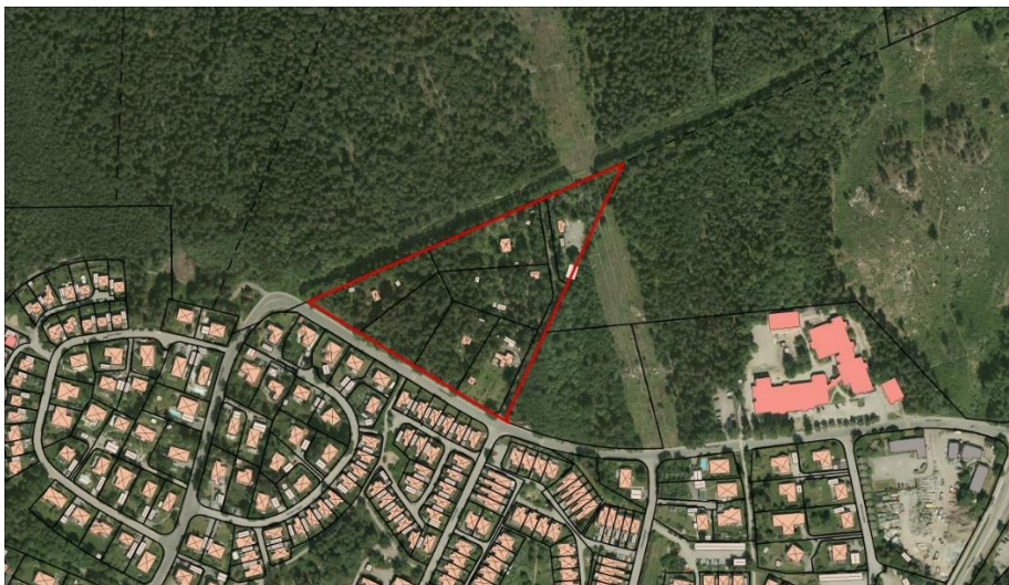
Figur 3: Ortofoto med området Skarpäng 62:1 - 62:7, markerat med rött.

Kommunstyrelsens utskott för stadsbyggnad, fastigheter och klimat meddelade den 22 maj 2023, § 40, positivt planbesked och gav stadsbyggnadsnämnden i uppdrag att pröva ny detaljplan för fastigheterna Skarpäng 62:1-62:7 och 62:10-62:11 i syfte att möjliggöra för utveckling av småhusbebyggelse, se figur 4. När detaljplanen har fått laga kraft kommer området att tas in i VA- verksamhetsområdet. Förberedande arbete inför planläggning påbörjades under hösten 2023.